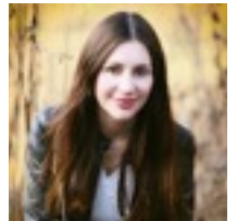
Nicole Müller - N-Inspiration Photography

„Mit meiner Anbieter-Präsenz auf Hochzeitsregion-Nürnberg.de konnte ich von Beginn an Kundenanfragen von Brautpaaren aus Nürnberg generieren. Vielen Dank - weiter so!“